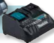
DC18RE, 198720-9 pikalatauslaite LXT ja CXT akuille.