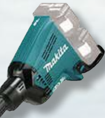
Ruohoraivurilisälaite EM404MP 198769-9