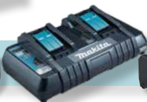
DC18RD, 196933-6 kahden akun latauslaite