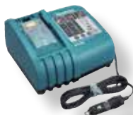
DC18SE, 194621-9 ajoneuvolaturi 12/24V