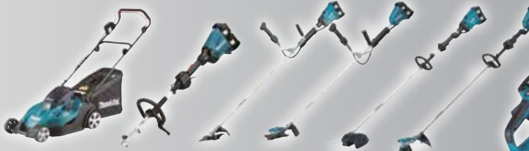
DLM431 / DLM380

Suorituskykyä kahdella 18V Li-ion akulla!