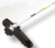
Ruohoraivurilisälaite EM406MP 198780-1