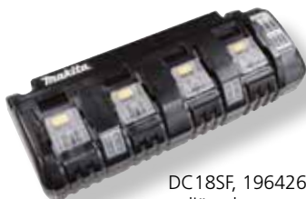
DC18SF, 196426-3 neljän akun latauslaite